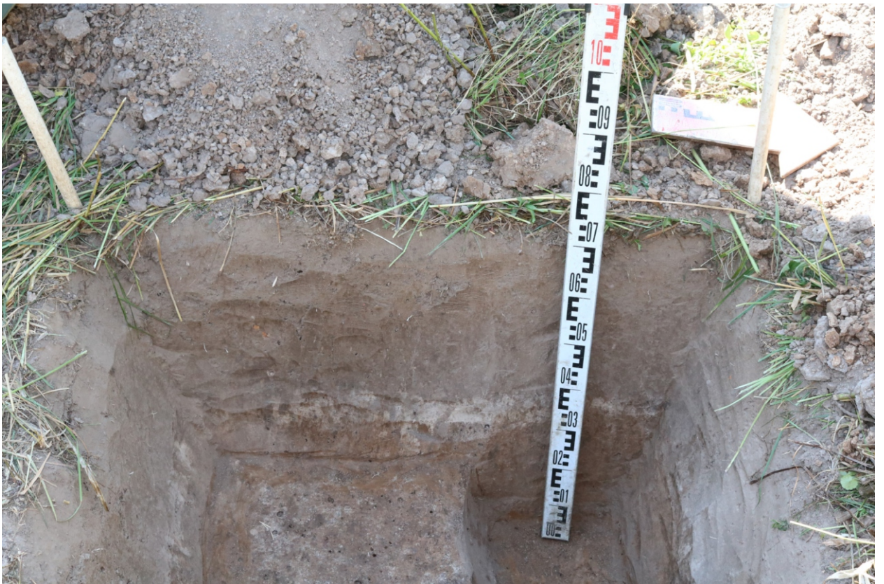
Рис. 23. Археологическое обследование участка по объекту: «Уличные газопроводы дер. Тужимово Бабынинского района Калужской области». 2023 г. Шурф 1. Западный борт. Вид с В.