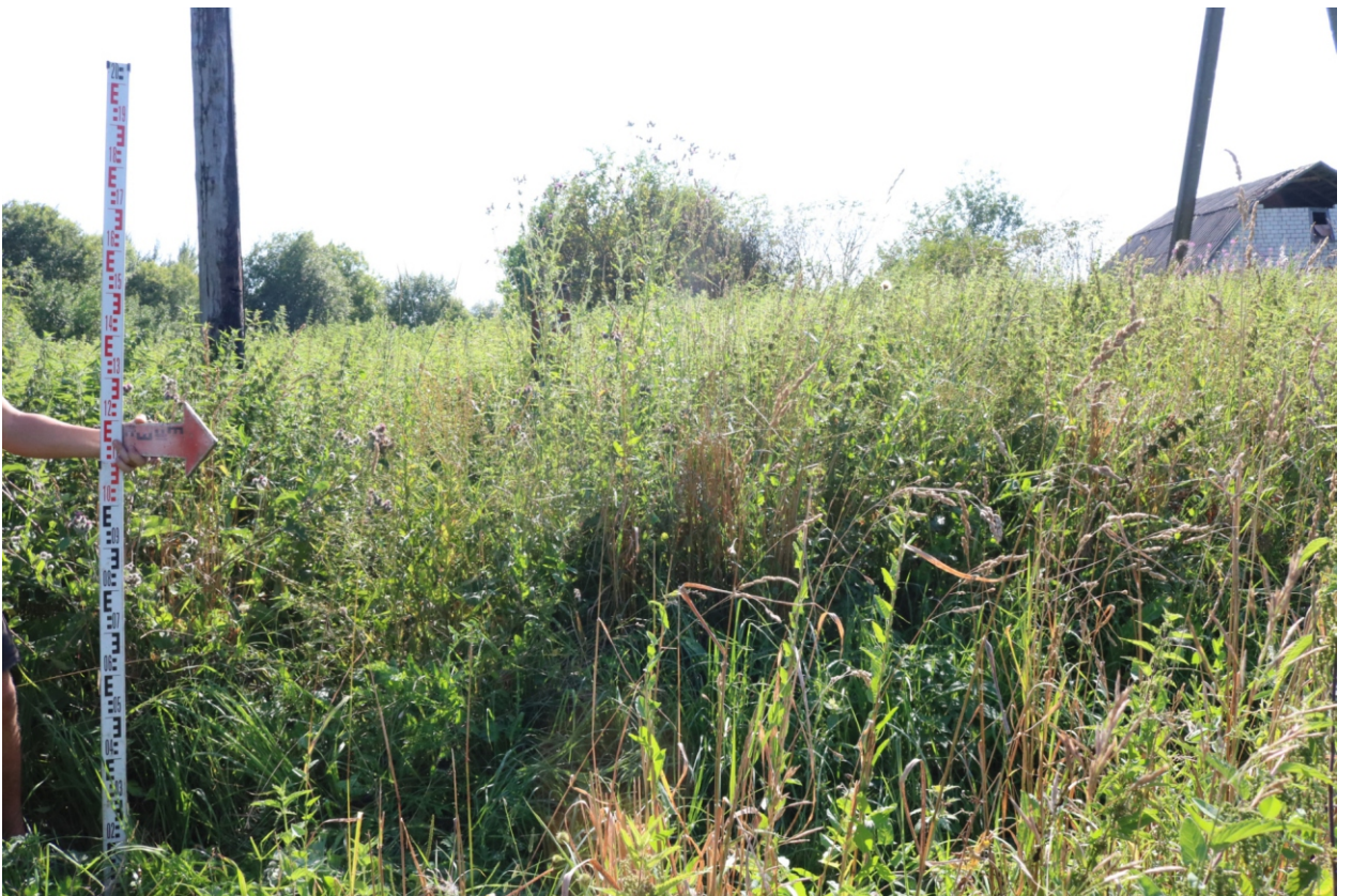
Рис. 15. Археологическое обследование участка по объекту: «Уличные газопроводы дер. Тужимово Бабынинского района Калужской области». 2023 г. Точка фотофиксации 4. Вид с СВ.