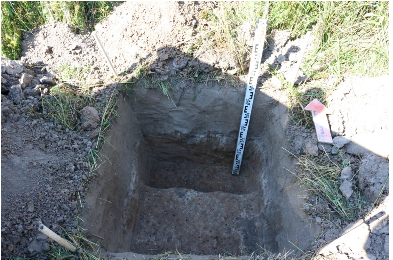
Рис. 22. Археологическое обследование участка по объекту: «Уличные газопроводы дер. Тужимово Бабынинского района Калужской области». 2023 г. Шурф 1. Материк (контрольный прокоп). Вид с Ю.