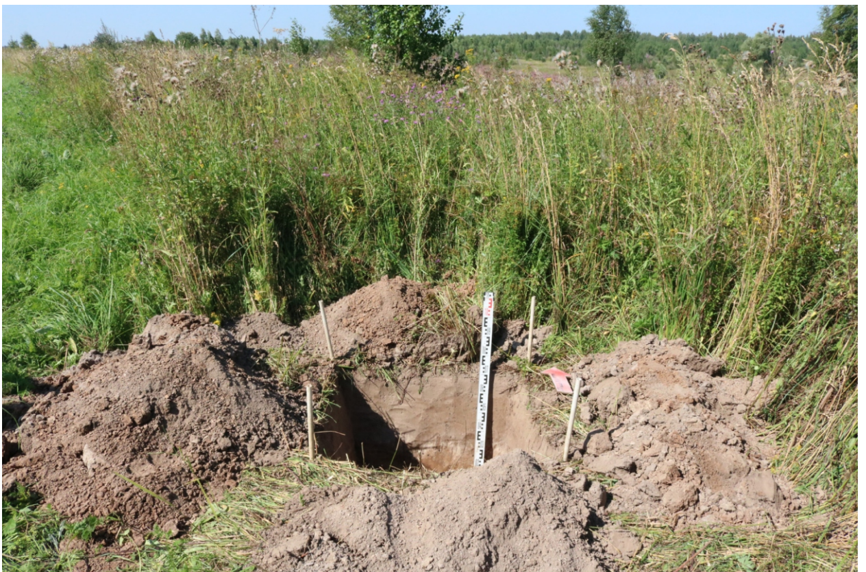
Рис. 21. Археологическое обследование участка по объекту: «Уличные газопроводы дер. Тужимово Бабынинского района Калужской области». 2023 г. Шурф 1. Общий вид с Ю после завершения работ.