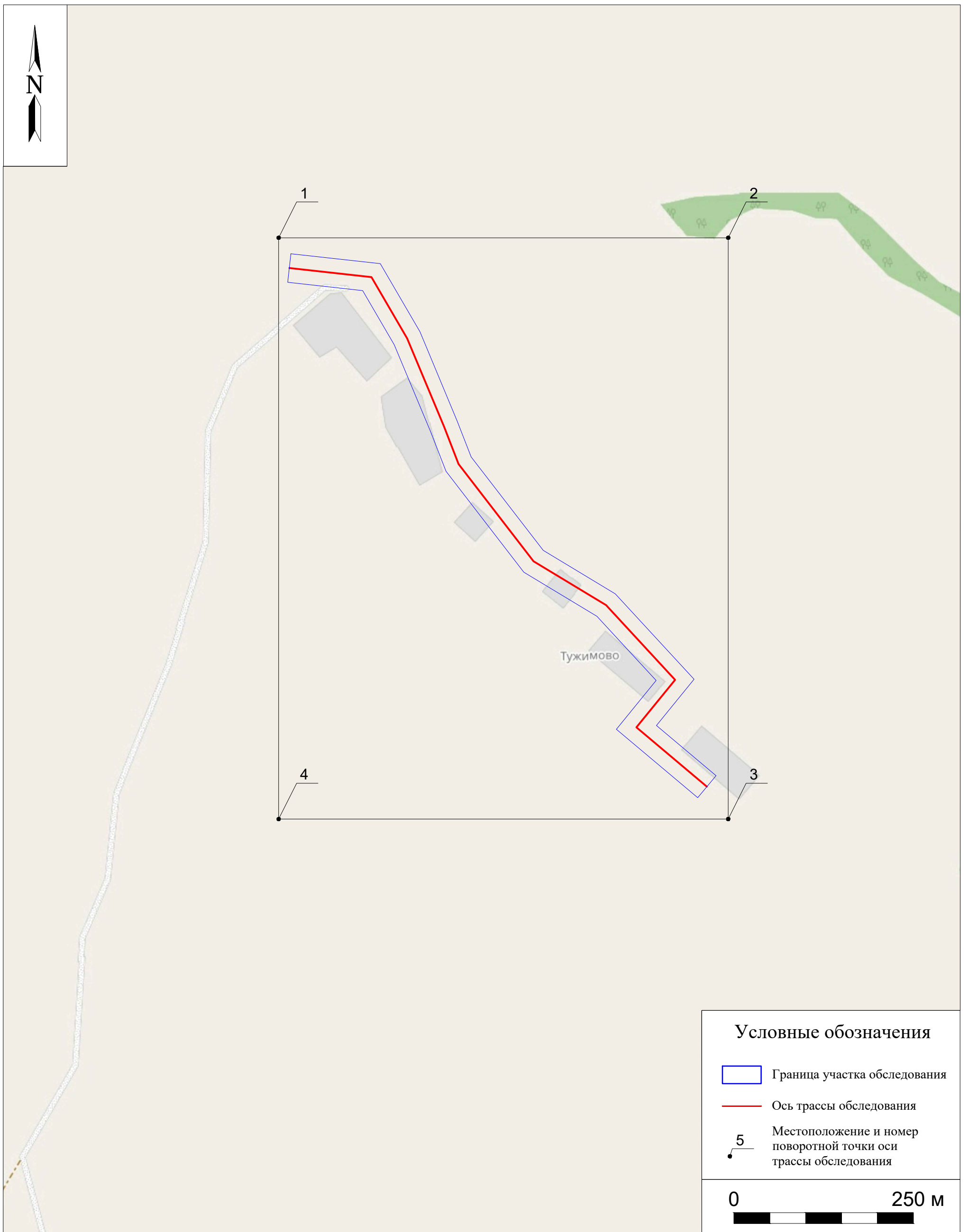
Рис. 6. Археологическое обследование участка по объекту: «Уличные газопроводы дер. Тужимово Бабынинского района Калужской области». 2023 г. Ситуационный план местности с указанием границ участка обследования и местоположением поворотных точек.