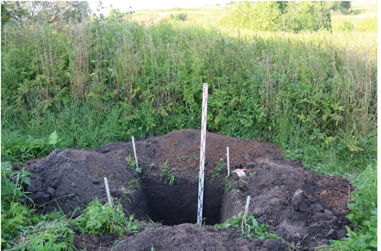
Рис. 26. Археологическое обследование участка по объекту: «Уличные газопроводы дер. Тужимово Бабынинского района Калужской области». 2023 г. Шурф 2. Общий вид с Ю после завершения работ.