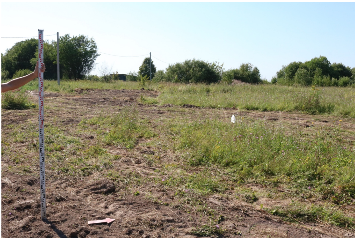
Рис. 12. Археологическое обследование участка по объекту: «Уличные газопроводы дер. Тужимово Бабынинского района Калужской области». 2023 г. Точка фотофиксации 3. Вид с В.