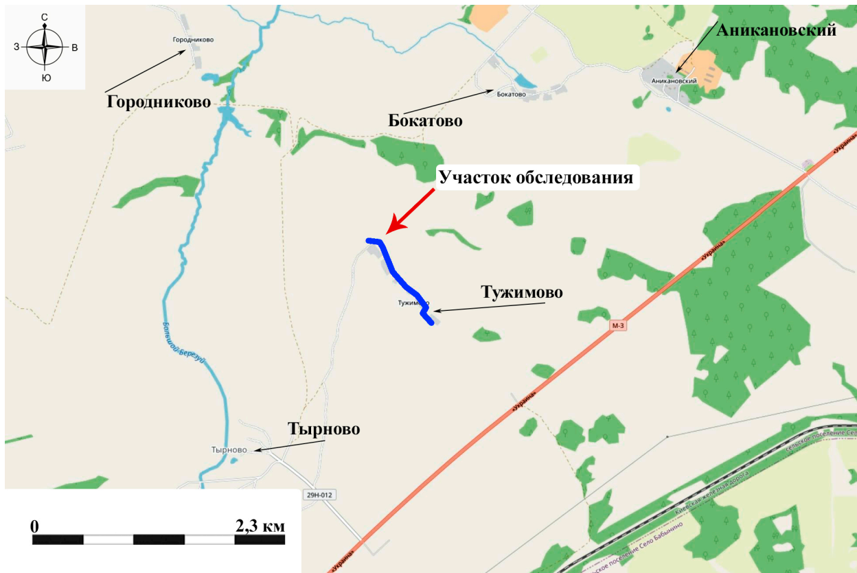
Рис. 3. Археологическое обследование участка по объекту: «Уличные газопроводы дер. Тужимово Бабынинского района Калужской области». 2023 г. Ситуационный план участка обследования.