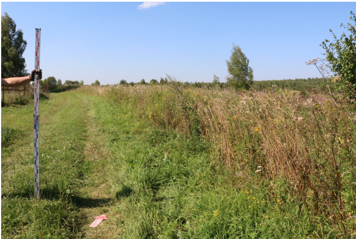
Рис. 8. Археологическое обследование участка по объекту: «Уличные газопроводы дер. Тужимово Бабынинского района Калужской области». 2023 г. Точка фотофиксации 1. Вид с ЮВ.