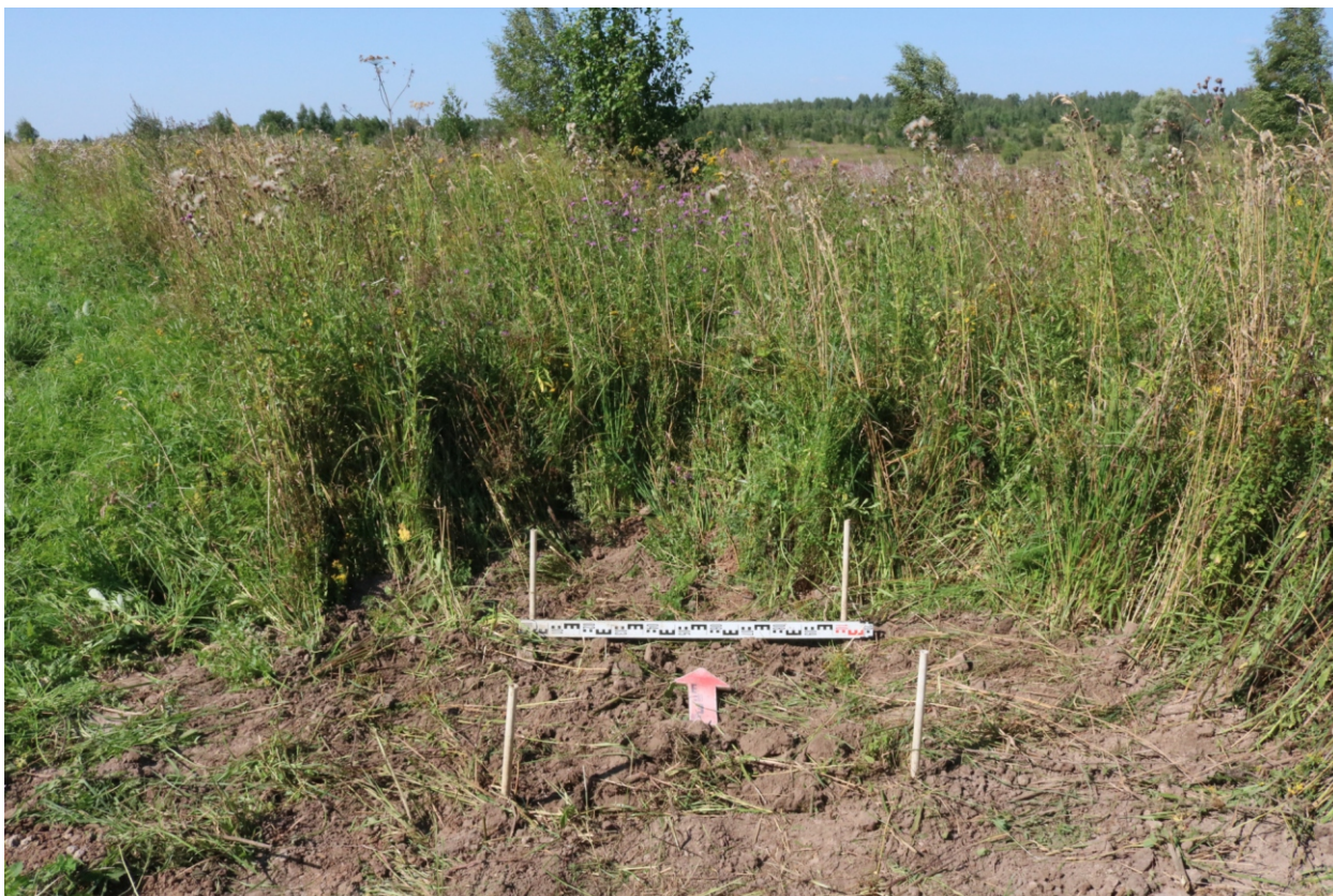
Рис. 24. Археологическое обследование участка по объекту: «Уличные газопроводы дер. Тужимово Бабынинского района Калужской области». 2023 г. Шурф 1. Рекультивация. Вид с Ю.