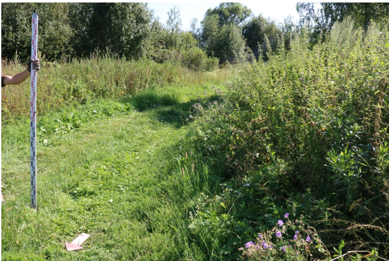
Рис. 9. Археологическое обследование участка по объекту: «Уличные газопроводы дер. Тужимово Бабынинского района Калужской области». 2023 г. Точка фотофиксации 1. Вид с СЗ.