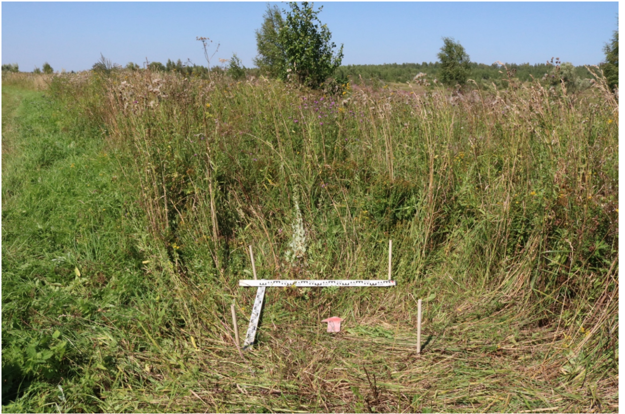
Рис. 20. Археологическое обследование участка по объекту: «Уличные газопроводы дер. Тужимово Бабынинского района Калужской области». 2023 г. Шурф 1. Общий вид с Ю до начала работ.