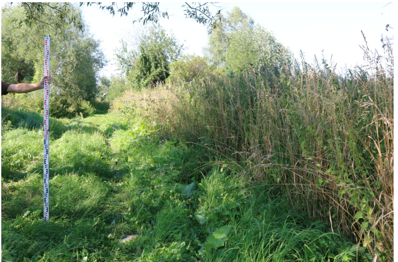
Рис. 11. Археологическое обследование участка по объекту: «Уличные газопроводы дер. Тужимово Бабынинского района Калужской области». 2023 г. Точка фотофиксации 2. Вид с ЮВ.