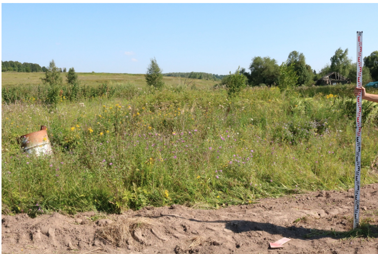
Рис. 13. Археологическое обследование участка по объекту: «Уличные газопроводы дер. Тужимово Бабынинского района Калужской области». 2023 г. Точка фотофиксации 3. Вид с СЗ.