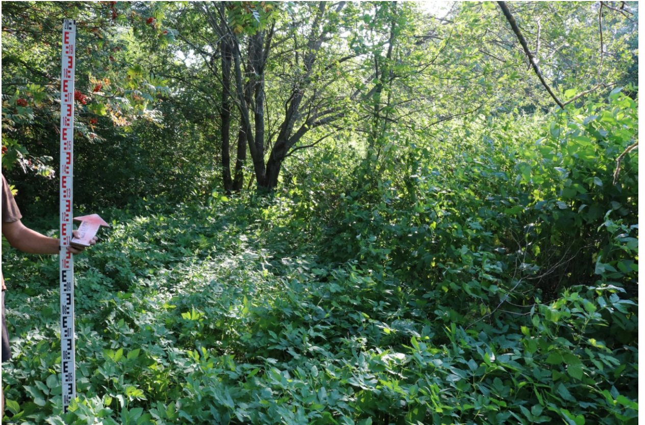
Рис. 18. Археологическое обследование участка по объекту: «Уличные газопроводы дер. Тужимово Бабынинского района Калужской области». 2023 г. Точка фотофиксации 6. Вид с ЮВ.