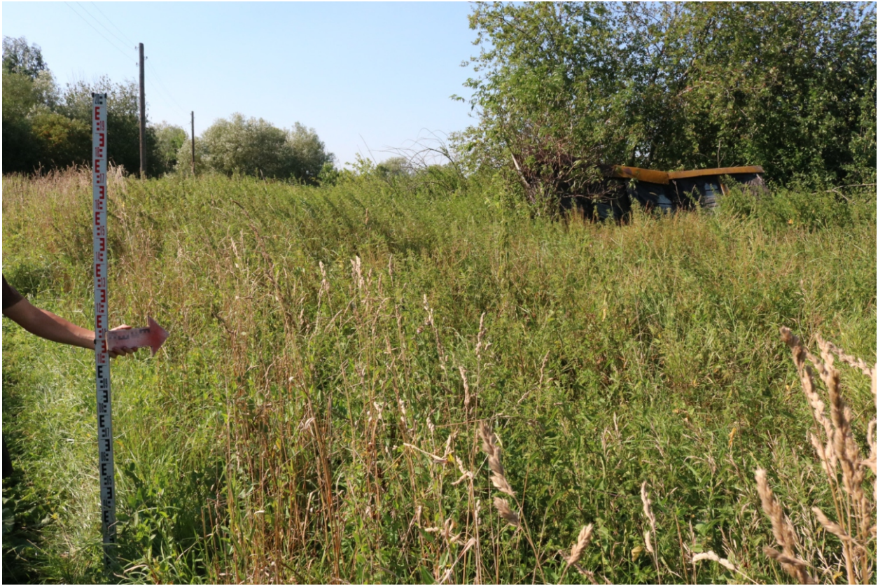
Рис. 14. Археологическое обследование участка по объекту: «Уличные газопроводы дер. Тужимово Бабынинского района Калужской области». 2023 г. Точка фотофиксации 4. Вид с В.