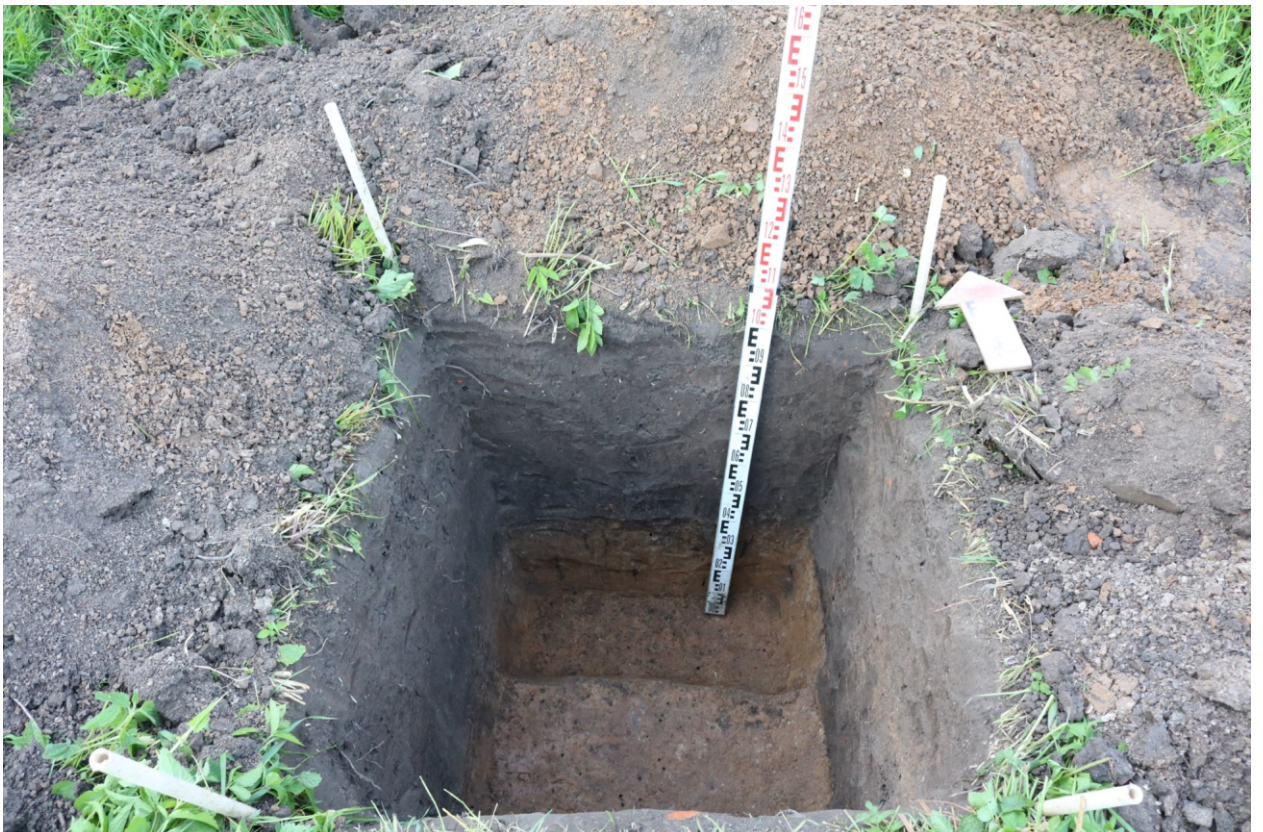
Рис. 27. Археологическое обследование участка по объекту: «Уличные газопроводы дер. Тужимово Бабынинского района Калужской области». 2023 г. Шурф 2. Материк (контрольный прокоп). Вид с Ю.