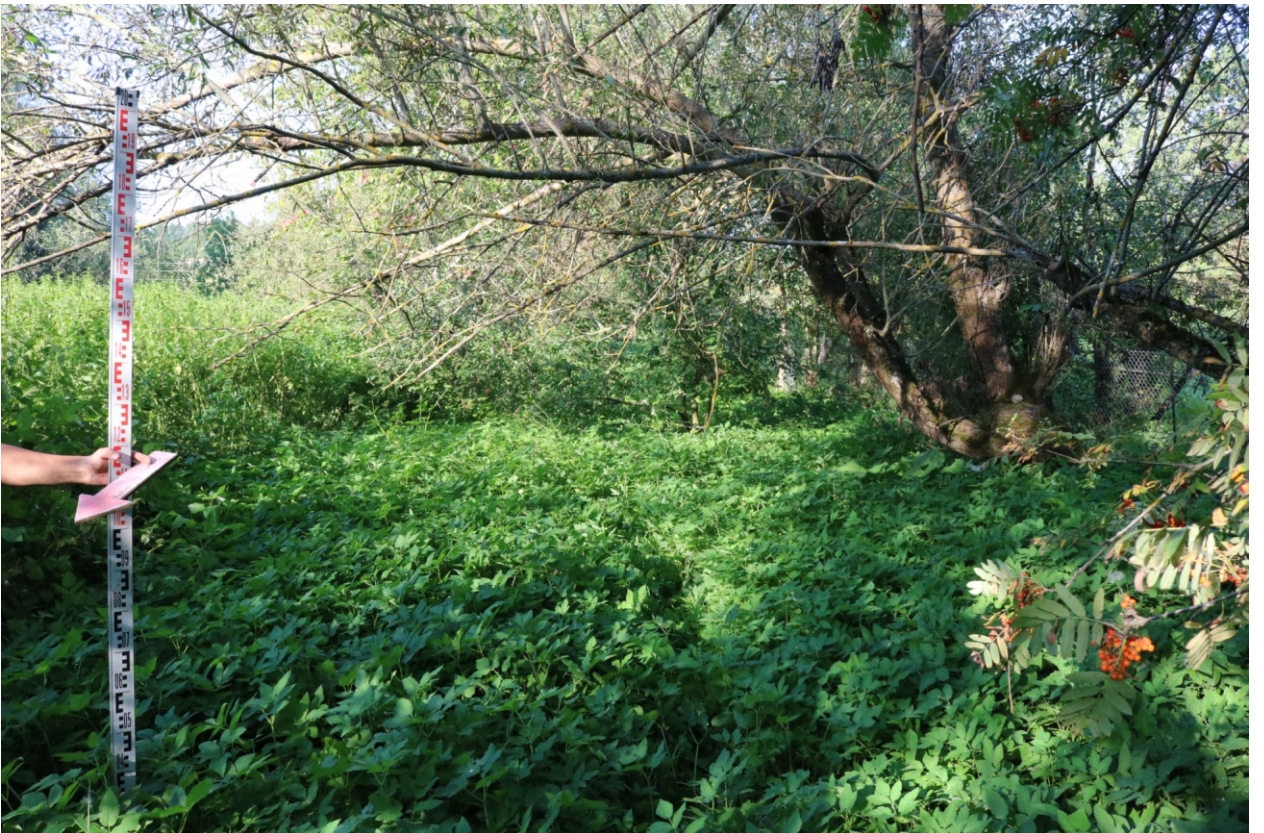
Рис. 19. Археологическое обследование участка по объекту: «Уличные газопроводы дер. Тужимово Бабынинского района Калужской области». 2023 г. Точка фотофиксации 6. Вид с СЗ.