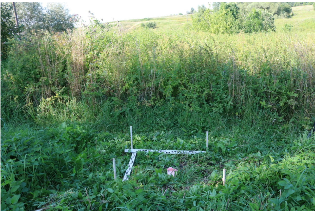
Рис. 25. Археологическое обследование участка по объекту: «Уличные газопроводы дер. Тужимово Бабынинского района Калужской области». 2023 г. Шурф 2. Общий вид с Ю до начала работ.