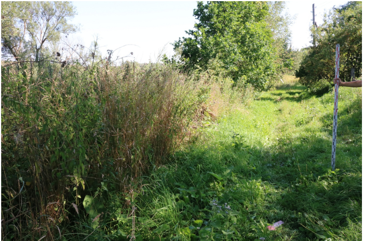
Рис. 10. Археологическое обследование участка по объекту: «Уличные газопроводы дер. Тужимово Бабынинского района Калужской области». 2023 г. Точка фотофиксации 2. Вид с СЗ.