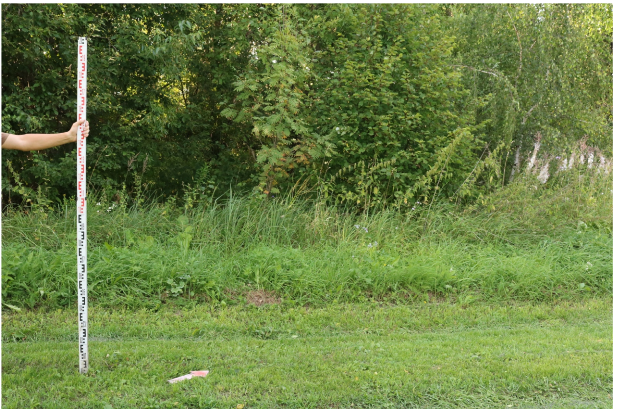
Рис. 17. Археологическое обследование участка по объекту: «Уличные газопроводы дер. Тужимово Бабынинского района Калужской области». 2023 г. Точка фотофиксации 5. Вид с ЮВ.