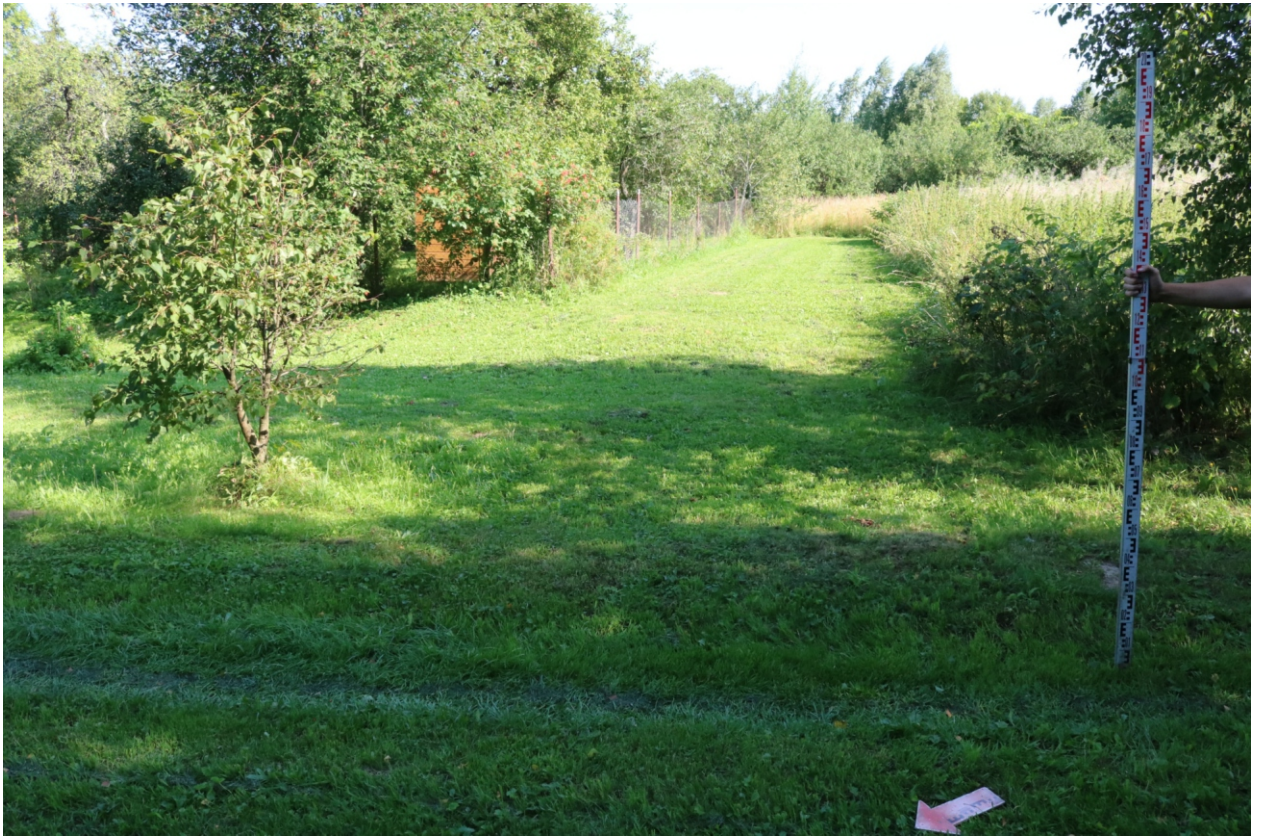
Рис. 16. Археологическое обследование участка по объекту: «Уличные газопроводы дер. Тужимово Бабынинского района Калужской области». 2023 г. Точка фотофиксации 5. Вид с СЗ.