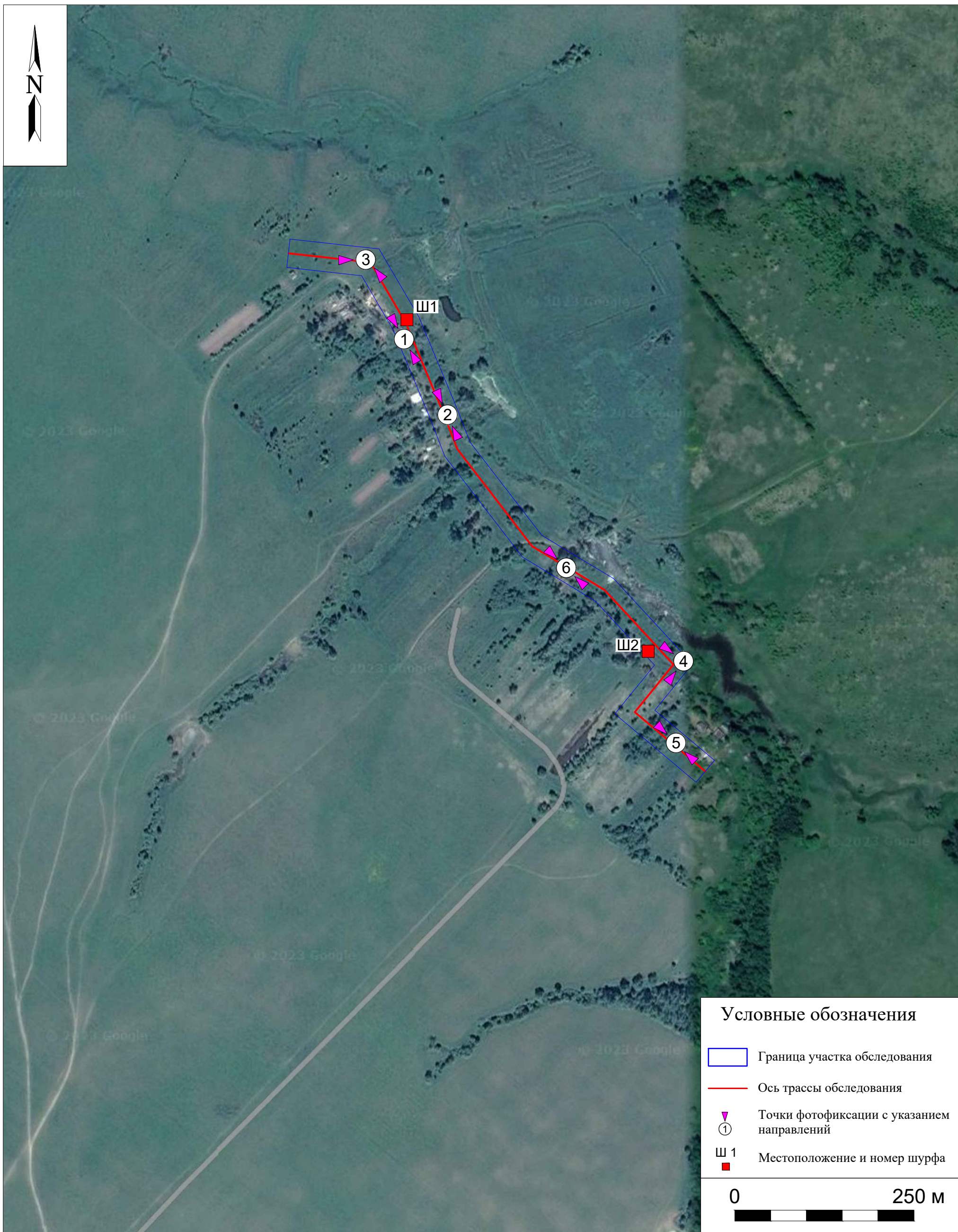
Рис. 7. Археологическое обследование участка по объекту: «Уличные газопроводы дер. Тужимово Бабынинского района Калужской области». 2023 г. Ось трассы обследования на космоснимке 2022 г. с указанием местоположения точек фотофиксаций и шурфов.