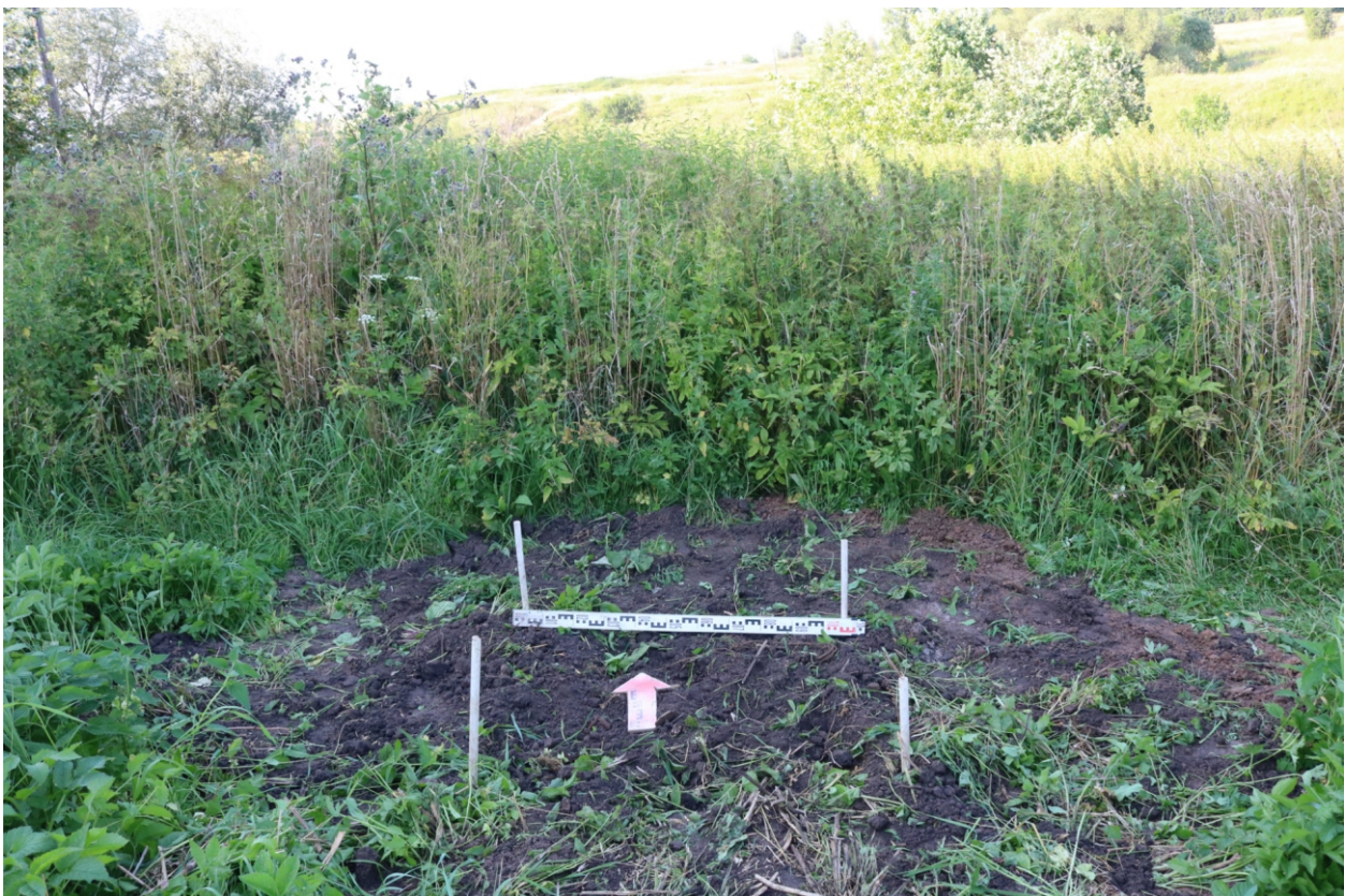
Рис. 29. Археологическое обследование участка по объекту: «Уличные газопроводы дер. Тужимово Бабынинского района Калужской области». 2023 г. Шурф 2. Рекультивация. Вид с Ю.