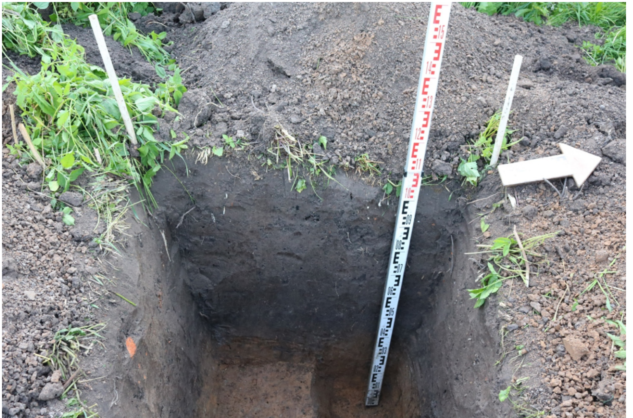
Рис. 28. Археологическое обследование участка по объекту: «Уличные газопроводы дер. Тужимово Бабынинского района Калужской области». 2023 г. Шурф 2. Западный борт. Вид с В.